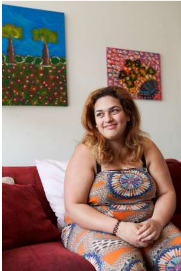
Figuur 2.

bijvoorbeeld voor slachtoffers van huiselijk geweld, een aantal ex-verslaafden en de jongeren met psychoses – is het zelfs slecht of gevaarlijk om (weer) een beroep te doen op hun oude sociale netwerk. Problemen, geweld en drugsgebruik binnen de relationele sfeer en de wijdere familie- en vriendenkring maken het voor deze mensen onmogelijk om naar 'huis' terug te keren; zij staan op een punt in hun leven waarin zij in sociale zin volledig opnieuw moeten beginnen.