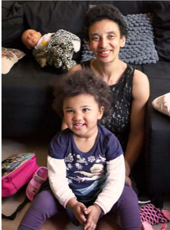
Figuur 4.