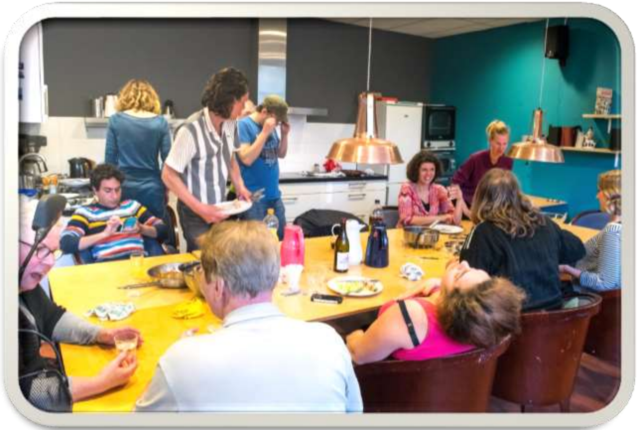
Buren!-groep West.