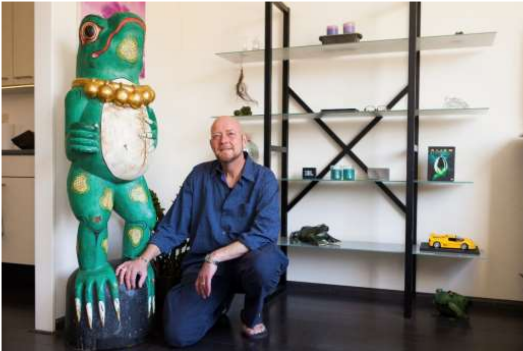
Figuur 3.

Het is opvallend hoe vaak het woord 'normaal' genoemd wordt door respondenten. Ze beschrijven hun situatie, hun beperking, hun probleem als iets wat 'niet normaal' is. Mensen met blijvende beperkingen hebben ook nauwelijks contact met 'normale' mensen, en hebben hier ook niet echt behoefte aan, zegt men. Mensen zonder beperkingen worden gezien als 'op een ander level'.